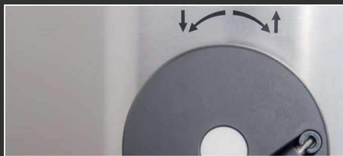
Manuálne sklápanie panvice