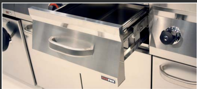
Zásuvky kompatibilné s gastronádobou

Kryt z nerezovej ocele. ▪ Horná doska z nerezovej ocele AISI 304 ▪ Úplne výsuvná zásuvka s kapacitou GN1/1 - 150mm. ▪ Nízky zadný komínok s liatinovým roštom.