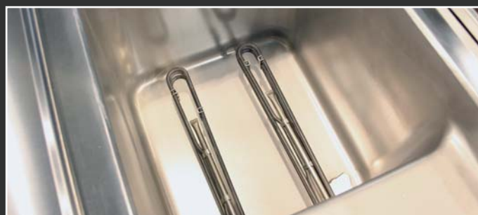
Kvalitné vyhrievacie telesá