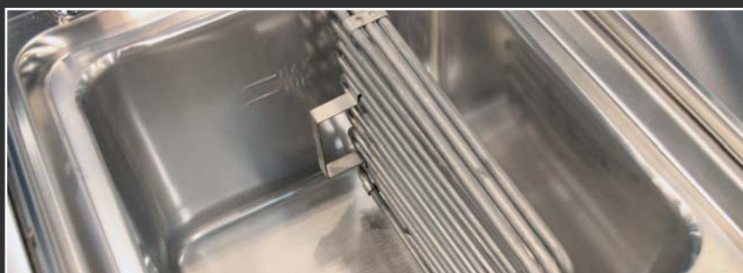
Trojité vyhrievacie telesá

Kryt z nerezovej ocele ▪ Lisovaná horná doska s hrúbkou 1,2 mm. ▪ Ergonomicky tvarované vane z AISI 304. ▪ Vypúšťanie oleja výpustným ventilom do GN nádoby s filtrom vo vnútri podstavca - vo verzii s podstavcom / vypúšťanie oleja spredu panela - vo verzii TOP. ▪ Vysoký výkon až 0,96 kW na 1 liter oleja ▪ Studená zóna medzi vyhrievacími telesami a dnom vane ▪ Otočné elektrické vyhrievacie telesá ▪ Ochrana ovládacích prvkov IPX4. ▪ Nízky zadný komínok s liatinovým roštom.