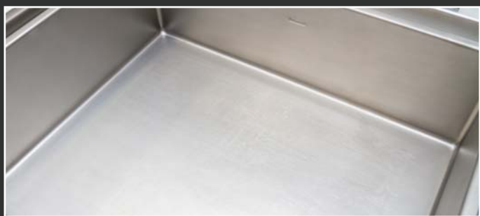
Rovnomerná distribúcia tepla po celej ploche

Objem vane 50l. ▪ Plocha vane 720 x 465 mm. ▪ Kryt z nerezovej ocele ▪ Veko z ocele AISI 304. ▪ Hrúbka dna panvice 12 mm. ▪ Dno zo špeciálnej zliatiny alebo nerezovej ocele. ▪ Jednoduchá obsluha. ▪ Systém ochrany pred popálením – špeciálna rukoväť a kryt veka. ▪ Rozsah teplôt 50-300°C. ▪ Ochrana ovládacích prvkov IPX4. ▪ Nízky zadný komínok s liatinovým roštom.