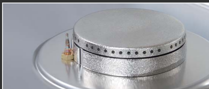
Plynové sporáky SPB