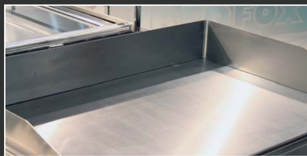
Veľká plocha grilovacej dosky